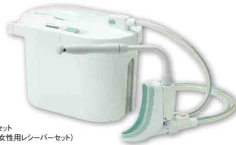
女性用セット (本体+女性用レシーバーセット)