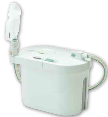
男性用セット (本体+男性用レシーバーセット)